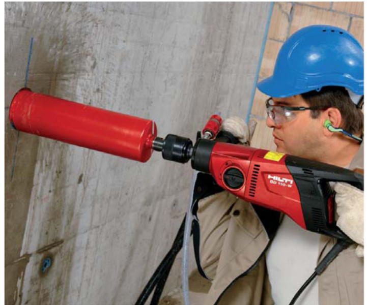
Figuur 1. Hilti DD 110W diamantboormachine met bijbehorend watersysteem

In de Tabel 1 worden de technische gegevens van de Hilti diamantboormachines vermeld