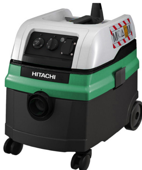
Hitachi stofzuiger RP250YDM(WA) met 5 meter afzuigslang Ø 35 mm en plastic stofzak (of gelijkwaardig)