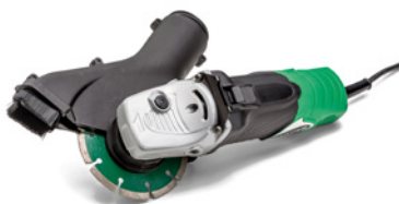
Hitachi haakse slijper met Dustco afzuigkap