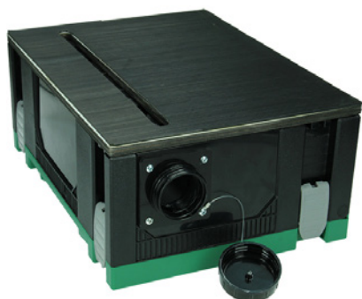
Hitachi (afgezogen) zaagtafel

IN COMBINATIE MET HITACHI STOFZUIGER RP250YDM(WA)