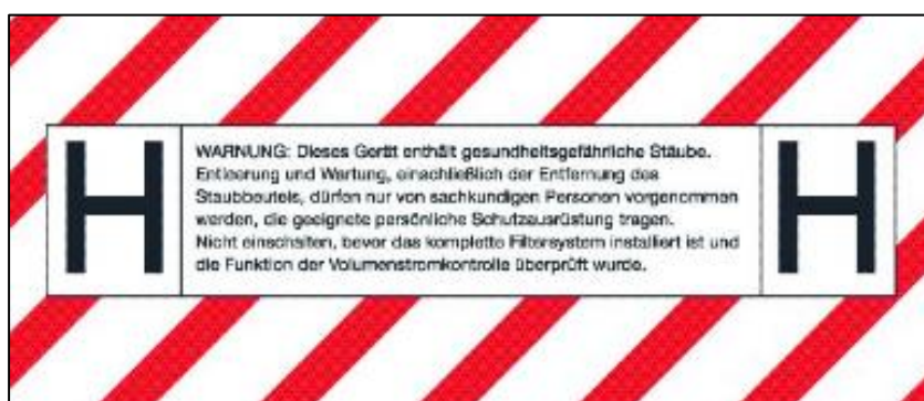
Voorbeeld Symbool voor stofklasse H.

Om te voldoen aan het afscheidingspercentage voor stofklasse H moet óf het toegepaste primaire filter, óf de veiligheidsstofzuiger als compleet apparaat, meer dan 99,995% van de deeltjes kleiner dan 0,3 µm afvangen (IEC 60335-2-69). Een HEPA 1 H14 filter, voldoet aan deze eis. Er zijn ook asbeststofzuigers voorzien van een HEPA H13 filter (>99,95%) met stofklasse H-certificering. Een dergelijke asbeststofzuiger voorziet als compleet apparaat (dus: HEPA filter in combinatie met de andere onderdelen) eveneens in een afscheidingspercentage van meer dan 99,995%. Wanneer aan alle eisen wordt voldaan, krijgt het apparaat een H-certificering toegekend. Een apparaat met een dergelijke certificering is voorzien van onderstaande sticker en is te herkennen aan het symbool voor stofklasse H.