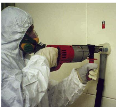
Stofzuiger bevestigd aan handgereedschap (HSE, 2017)

Momenteel zijn er gereedschappen op de markt met een geïntegreerd afzuigstelsel. Voor verschillende typen gereedschappen zijn speciale stofkappen ontwikkeld waaraan een stofzuiger gekoppeld kan worden. Dergelijke systemen zijn nog niet specifiek ontwikkeld voor werkzaamheden aan/met asbesthoudende toepassingen.