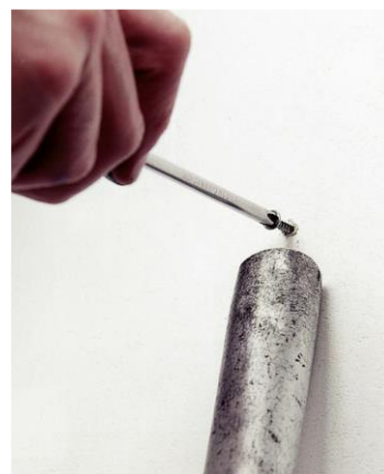
Stofzuiger als puntafzuiging (HSE, 2017)