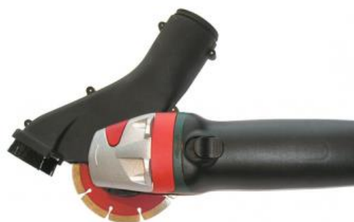
Voorbeeld adapter voor stofzuiger voor handgereedschap